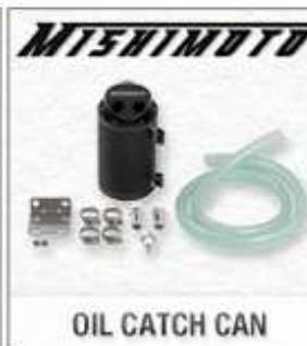
OIL CATCH CAN