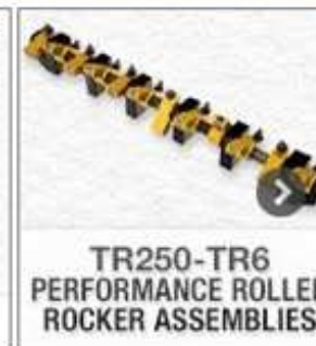
TR250-TR6 PERFORMANCE ROLLER ROCKER ASSEMBLIES