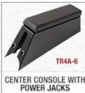
TR4A-6 CENTER CONSOLE WITH POWER JACKS