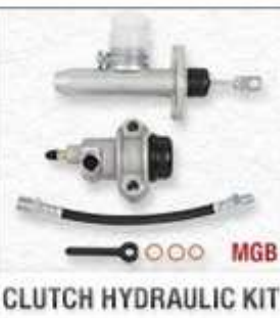
CLUTCH HYDRAULIC KIT

// ENGINE // // GEARBOX // // CLUTCH // // LAMPS //